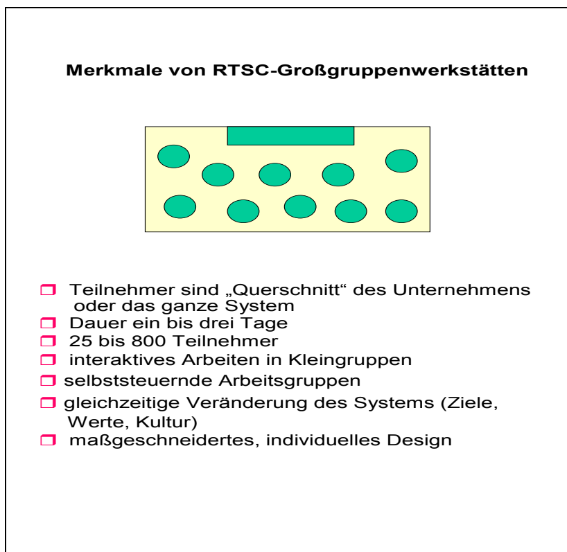
Abbildung 3: Merkmale einer RTSC-Großgruppenwerkstatt

Wer einen derartigen Einbeziehungsprozess einmal erlebt hat, wird ihn nicht mehr missen wollen.