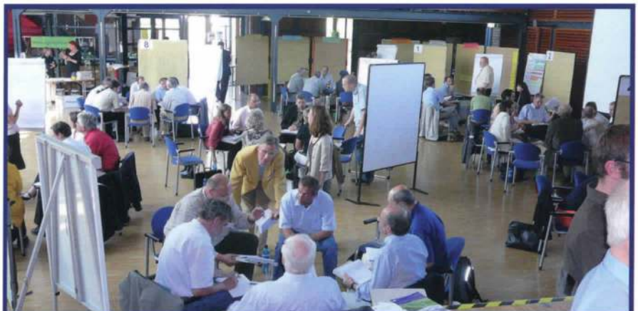
Viele Inhalte des Veränderungsprojektes werden von den Mitarbeitern erarbeitet.

Theobald: Dies ist ein ganz wichtiger Punkt für die erfolgreiche Umsetzung des Change Prozesses. Grundsätzlich führt ein Change Projekt zu einer Mehrbelastung der kompletten Organisation, da neben dem Projekt noch das Tagesgeschäft zu bewältigen ist. Hilfreich ist eine klare Kommunikation, was auf