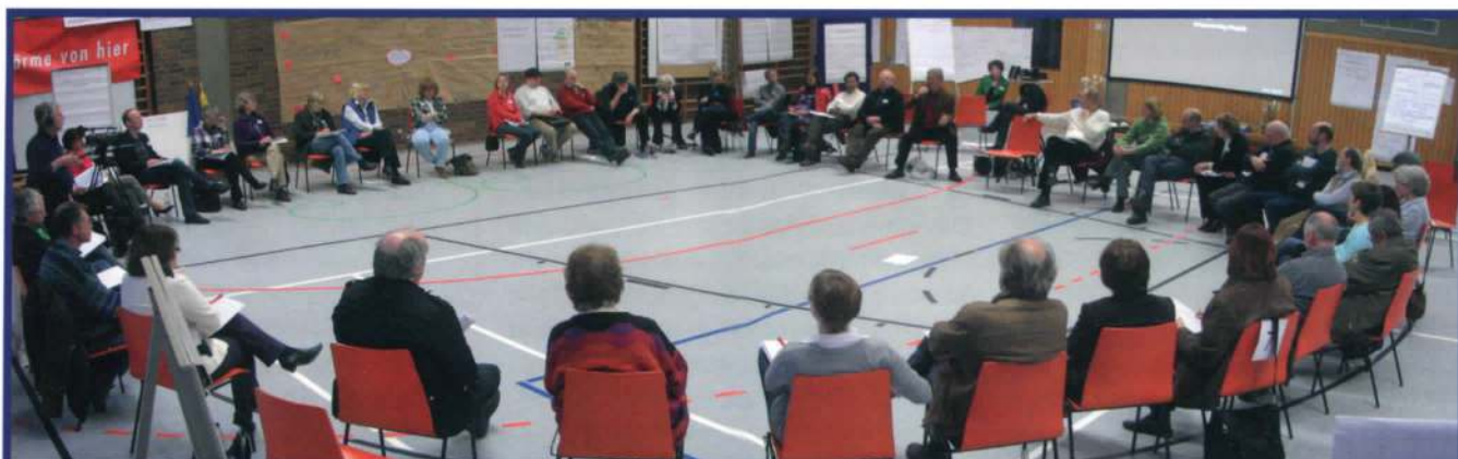
Alle Beteiligten brauchen Klarheit über die Projektziele, die man gemeinsam erreichen will.

gut bzw. ausreichend ist, kommt in vielen Fällen durch Markt- und Kunden-Feedbacks.